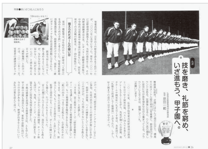
青森県弘前学園聖愛高等学校 硬式野球部の甲子園までの道