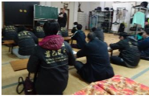
体験感想レポート