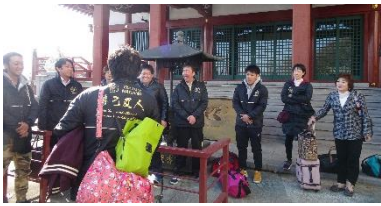
午後1時 活禅寺 集合