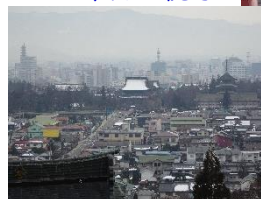
活禅寺からの善光寺