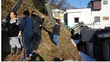
作務 男性は重い足場移動