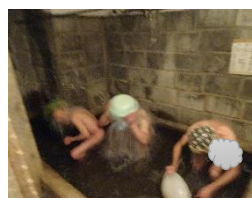
この日初めての水行