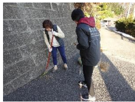
女性は境内の清掃