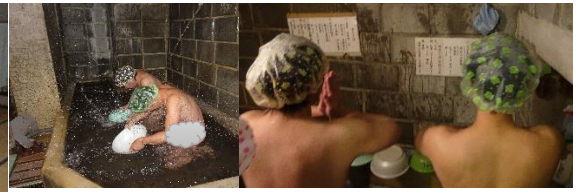
目が覚めたらすぐ水行を行います