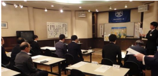
岡谷市(倫)MSリハーサル