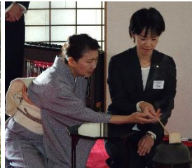
お茶を教えてくださいました