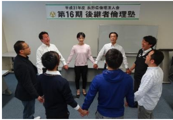
基本動作のウォーニング アップ